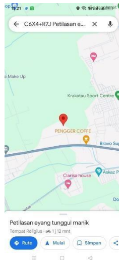
Gamabr 7. Maps Screen

menjadi sangat praktis dalam kehidupan sehari-hari untuk menemukan lokasi-lokasi yang signifikan pada wisata religi tersebut. Gambar 7 di bawah ini menunjukkan salah satu lokasi dari wisata di atas