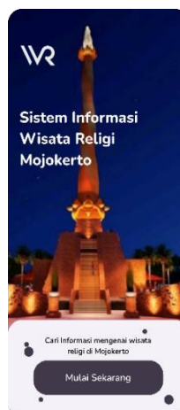
Gambar 4. On boarding

On boarding berfungsi sebagai halaman pembuka di dalam aplikasi, saat user pengguna membuka aplikasi aplikasi menampilkan halaman pembuka/on boarding di dalam halaman pembuka ini memiliki fitur tombol button yang bertuliskan “(Mulai Sekarang)”, Setelah user pengguna menekan tombol tersebut pengguna akan langsung menuju ke halaman Utama, dan fitur tersebut seperti Gambar 4 di bawah ini: