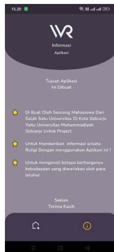
Gambar 8. Tampilan Informasi

Tampilan informasi ini menyajikan informasi tentang Wisata Religi beserta rincian di dalamnya, termasuk lokasi, asal-usul, sejarah, dan memberikan motivasi kepada pengguna untuk mungkin mengembangkan aplikasi yang telah dibuat. Gambar 8 di bawah ini memberikan ilustrasi visual terkait hal tersebut.