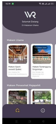
Gambar 4. Main Screen

Main Screen berperan sebagai tampilan awal/Halaman utama, dan dalam tampilan tersebut, terdapat beberapa beranda yang menampilkan menu wisata wisata religi yang tertera di dalam aplikasi wisata religi secara rinci. Untuk melihat informasi lebih detail, pengguna dapat menekan tombol detail menu yang tersedia di layar utama. Hal ini akan membuka tampilan khusus yang menampilkan rincian lebih lanjut dari menu tersebut seperti yang terlihat pada gambar 5 dibawah ini.