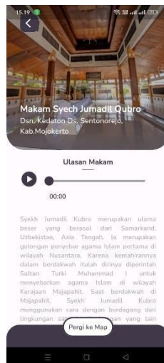
Gambar 6. Information screen

Halaman informasi, atau yang disebut sebagai "Information Screen," memiliki tujuan untuk menyajikan informasi wisata secara komprehensif. Di dalam halaman informasi ini, terdapat tiga fitur utama. Pertama, fitur ini menyediakan ulasan yang menguraikan sejarah panjang dari makam religi yang dipilih oleh pengguna. Fitur ini memberikan opsi kepada pengguna untuk mendengarkan informasi sejarah secara rinci dengan menekan tombol suara yang disediakan. Hal ini mirip dengan tampilan pada gambar 6 di bawah ini.