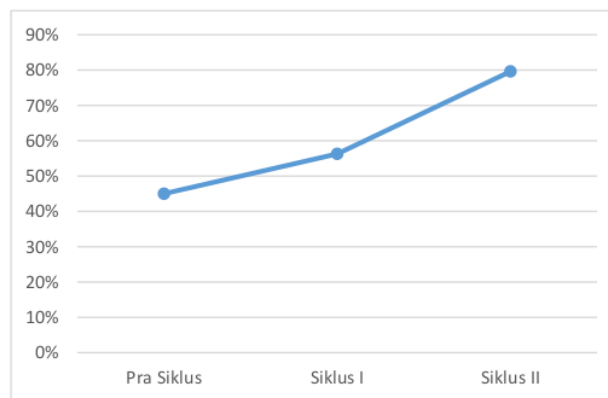
Gambar 1. Hasil Peningkatan Kemampuan Mengenal Huruf pada tahap Pra siklus, Siklus I, dan Siklus II

Hasil presentase yang didapat dari tabel di atas pada pra siklus mendapatkan presentase sebesar 45% , pada siklus I sebesar 56.3%, sedangkan siklus II mendapatkan presentase sebesar 79,6%. Maka dapat disimpulkan bahwa dalam meningkatkan kemampuan mengenal huruf anak dapat dikatakan berhasil dan diberhentikan di siklus II. Hal ini dapat dilihat pada grafik peningkatan kemampuan mengenal huruf pada anak usia 4-5 tahun di TK Aisyiyah Bustanul Athfal 1 Candi sebagai berikut: