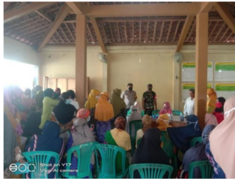
Gambar 2. Foto bersama warga dan aparatur desa

Berdasarkan table 2 tersebut dapat diketahui bahwa jumlah pegawai masih didominasi laki-laki. Dimana pegawai laki-laki tercatat berjumlah 6 orang dan perempuan 3 orang. Dengan hal tersebut telah diketahui bahwa jumlahnya memiliki perbedaan. Beberapa kegiatan yang dilibatkan yaitu pembagian bantuan social di Desa Candi Wates. Berikut adalah pengambilan foto secara langsung pembagian bantuan dengan beberapa aparatur desa dan warga sekitar: