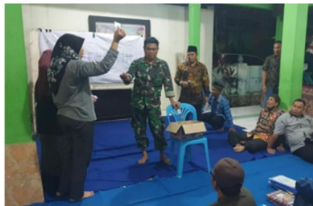
Gambar 3. Kegiatan Sosialisasi Program dan Pemilihan Penanggungjawab

Berdasarkan wawancara diatas dapat diketahui bahwa dalam implementasi pembangunan Desa Berbasis Gender di Desa Candiwates masih terus dilakukan dan membuat susunan program-program yang ramah gender. Sehingga nanti akan membentuk Desa Candiwates yang maju dan kuat. Berikut adalah saat sosialisasi dan menjelaskan suatu program dengan beberapa warga serta aparat desa :