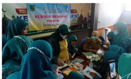
Gambar 1. Sosialisasi Pelatihan Kursus Memasak

Berdasarkan wawancara diatas dapat diketahui bahwa di Desa Candiwates pembangunan berbasis gender tlah terlaksana sebagaimana diketahui bahwa di Desa Candiwates sekretaris desa diwakili oleh perempuan sehingga nantinya akan lebih diimplemnetasikan lagi pembangunan berbasis gender di Desa Candiwates tersebut. Dimana komunikasinya mellalui kegiatan-kegiatan yang berbasis gender salah satunya mellalui PKK Desa Candiwates tersebut. Berikut adalah salah satu bukti sosialisasi dengan ibu-ibu PKK desa Lambangan :