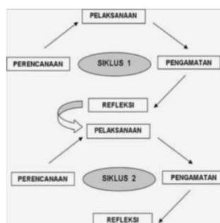
Gambar 1. Siklus Pelaksanaan PTK

Teknik pengumpulan data penelitian ini melalui Observasi langsung, wawancara, dan dokumentasi. Observasi dilakukan untuk mengetahui proses pembelajaran kegiatan mewarnai teknik gradasi untuk meningkatkan kreativitas anak. Kemudian dengan wawancara bertujuan untuk menggali informasi yang sedang diteliti. Dokumentasi sangat penting untuk peneliti, seperti catatan harian siswa, guru, kepala sekolah yang terkait dengan penelitian [19]. Analisis data penelitian tindakan kelas ini dengan kualitatif, data diperoleh dari aktivitas anak dan guru berupa hasil observasi dan wawancara. Sedangkan data kuantitatif diperoleh melalui rata-rata kesempatan belajar yang telah diberikan kepada anak [20]. Adapun indikator kreativitas anak, yang meliputi ciri-ciri antara lain :