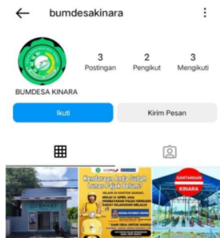
Gambar 2. Akun Instagram BUMDes Kinara

Berdasarkan wawancara diatas maka dapat disimpulkan bahwa cara komunikasi pengurus Kinara BUMDes dengan anggotanya bisa dilakukan melalui pesan chat lalu kemudian dilakukan pertemuan setelahnya. Hampir setiap hari di BUMDes Kinara bapak Lurah sehingga memudahkan berkomunikasi dengan perangkat desa. Selain itu, dalam menyampaikan komunikasi disini BUMDes Kinara juga memiliki beberapa media sosial seperti berikut ini: