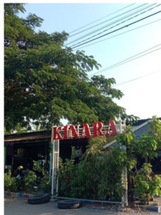
Gambar 4. Plang BUMDes Kinara

Berdasarkan gambar diatas dapat kita lihat bahwa dalam menyampaikan informasi disini BUMDes Kinara dapat melalui akun media sosial yang dimilikinya. Namun, untuk saat ini akun yang ada masih baru. Media tersebut digunakan BUMDes untuk menyampaikan informasi terkait hal yang ada di BUMDes. Demikian karena setiap organisasi ataupun suatu lembaga desa harus jelas dan tidak tertutup sehingga kepercayaan masyarakat bisa didapat. Untuk situs khusus BUMDes Kinara saat ini belum ada, namun bagi masyarakat yang ingin mengetahui lebih lanjut tentang badan usaha milik desa bisa mengakses situs web yakni https://kemiri-sidoarjo.web.id yang mana segala hal mengenai Desa Kemiri khususnya BUMDes Kinara sudah tersedia. Oleh sebab itu karena media sosial yang ada masih baru disini sebelumnya BUMDes Kinara juga menyampaikan informasi melalui plakat atau plang yang ada di sekitar BUMDes, berikut gambarnya: