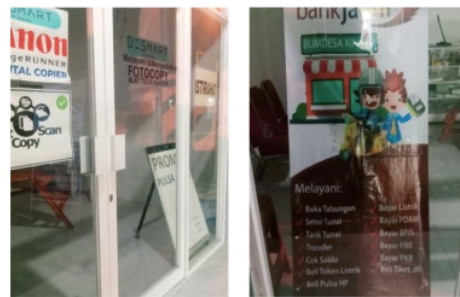
Gambar 1. Unit Usaha Desmart Kinara