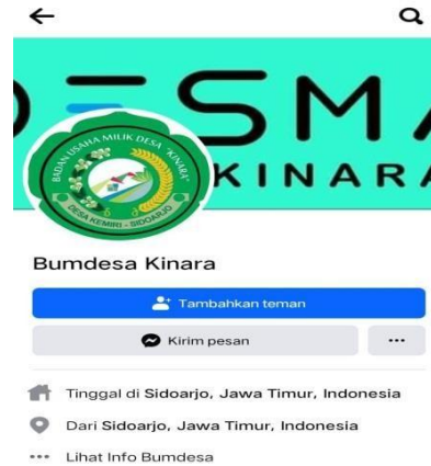
Gambar 3. Akun Facebook BUMDes Kinara

Berdasarkan gambar diatas dapat kita lihat bahwa dalam menyampaikan informasi disini BUMDes Kinara dapat melalui akun media sosial yang dimilikinya. Namun, untuk saat ini akun yang ada masih baru. Media tersebut digunakan BUMDes untuk menyampaikan informasi terkait hal yang ada di BUMDes. Demikian karena setiap organisasi ataupun suatu lembaga desa harus jelas dan tidak tertutup sehingga kepercayaan masyarakat bisa didapat. Untuk situs khusus BUMDes Kinara saat ini belum ada, namun bagi masyarakat yang ingin mengetahui lebih lanjut tentang badan usaha milik desa bisa mengakses situs web yakni https://kemiri-sidoarjo.web.id yang mana segala hal mengenai Desa Kemiri khususnya BUMDes Kinara sudah tersedia. Oleh sebab itu karena media sosial yang ada masih baru disini sebelumnya BUMDes Kinara juga menyampaikan informasi melalui plakat atau plang yang ada di sekitar BUMDes. berikut gambarnya: