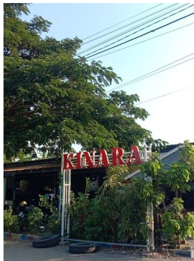
Gambar 4. Plang BUMDes Kinara

Berdasarkan gambar diatas dapat kita lihat bahwa dalam menyampaikan informasi disini BUMDes Kinara dapat melalui akun media sosial yang dimilikinya. Namun, untuk saat ini akun yang ada masih baru. Media tersebut digunakan BUMDes untuk menyampaikan informasi terkait hal yang ada di BUMDes. Demikian karena setiap organisasi ataupun suatu lembaga desa harus jelas dan tidak tertutup sehingga kepercayaan masyarakat bisa didapat. Untuk situs khusus BUMDes Kinara saat ini belum ada, namun bagi masyarakat yang ingin mengetahui lebih lanjut tentang badan usaha milik desa bisa mengakses situs web yakni https://kemiri-sidoarjo.web.id yang mana segala hal mengenai Desa Kemiri khususnya BUMDes Kinara sudah tersedia. Oleh sebab itu karena media sosial yang ada masih baru disini sebelumnya BUMDes Kinara juga menyampaikan informasi melalui plakat atau plang yang ada di sekitar BUMDes. berikut gambarnya: