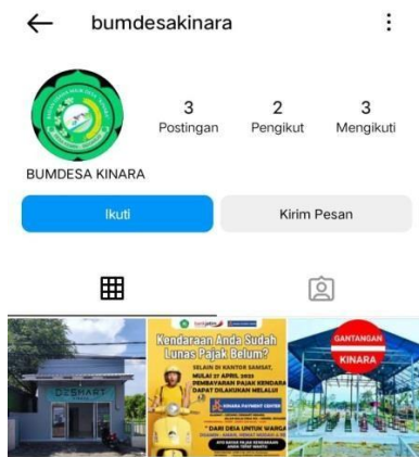
Gambar 2. Akun Instagram BUMDes Kinara

Berdasarkan wawancara diatas maka dapat disimpulkan bahwa cara komunikasi pengurus Kinara BUMDes dengan anggotanya bisa dilakukan melalui pesan chat lalu kemudian dilakukan pertemuan setelahnya. Hampir setiap hari di BUMDes Kinara bapak Lurah sehingga memudahkan berkomunikasi dengan perangkat desa. Selain itu, dalam menyampaikan komunikasi disini BUMDes Kinara juga memiliki beberapa media sosial seperti berikut ini: