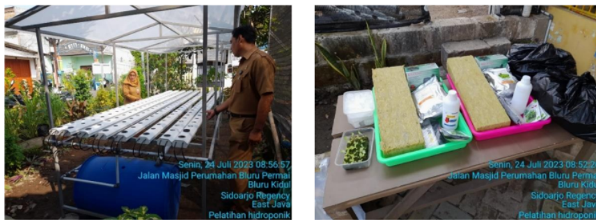
Gambar 5: Fasilitas peralatan dan perlengkapan kegiatan KRPL