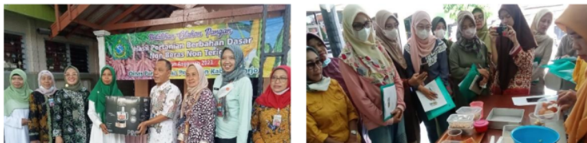
Gambar 6: Fasilitas peralatan dan perlengkapan kegiatan (MP3L)

Pada gambar 5 terdapat instalasi hidroponik sebagai wadah tanaman yang terbuat dari pipa pvc , kemudian Bak benih, nampan, papan penutup, rockwool, net pot, penyemprot flanel, gelas ukur, TSD / EC meter, dan pH meter, air, pupuk AB Mix, dan bibit tanaman pakcoy.