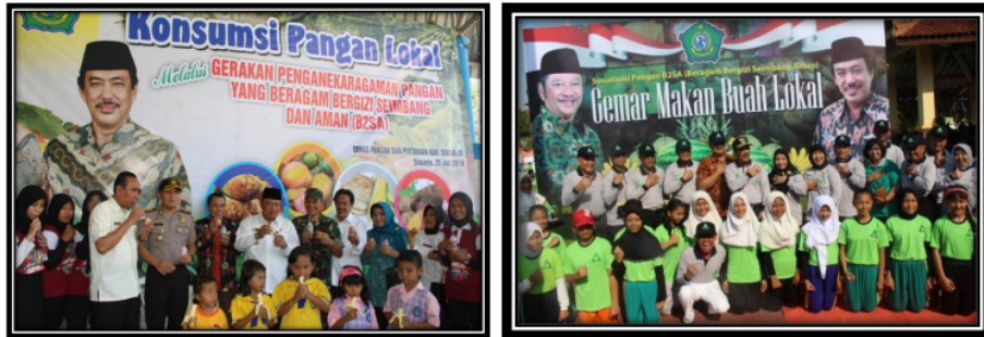
Gambar 2: Sosialisasi Pangan Beragam Bergizi Seimbang dan Aman (B2SA) Dalam Rangka Peringatan Hari Anak Nasional 2018 Kabupaten Sidoarjo