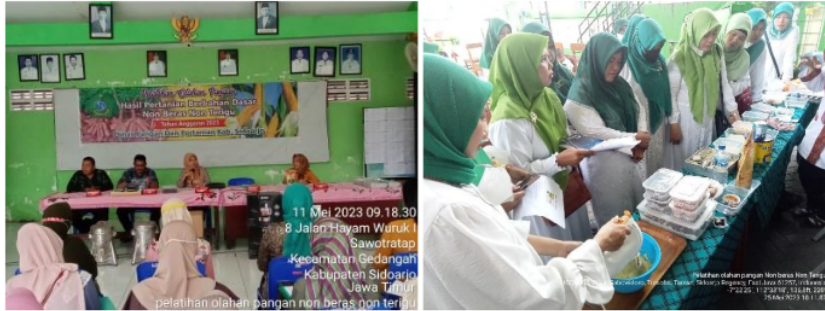
Gambar 4: Kegiatan Penyuluhan Model Pengembangan Pangan Pokok Lokal (MP3L)