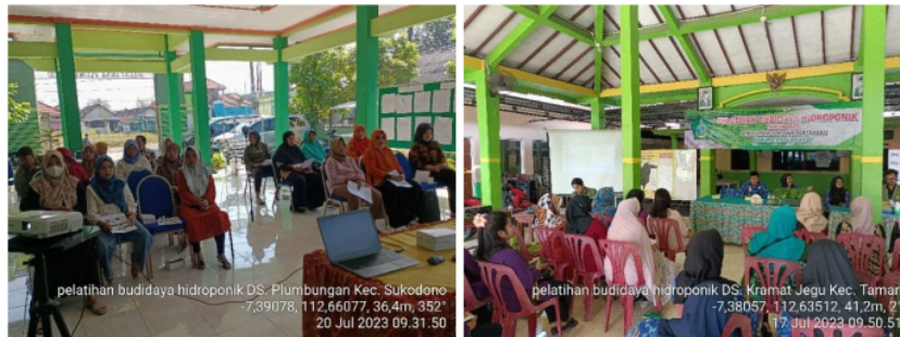
Gambar 3: Kegiatan penyuluhan Optimalisasi Pemanfaatan Pekarangan melalui konsep Kawasan Rumah Pangan Lestari (KRPL)