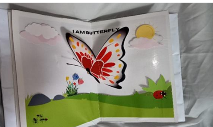
Gambar 6. Tampilan Halaman 3 "KUPU-KUPU"