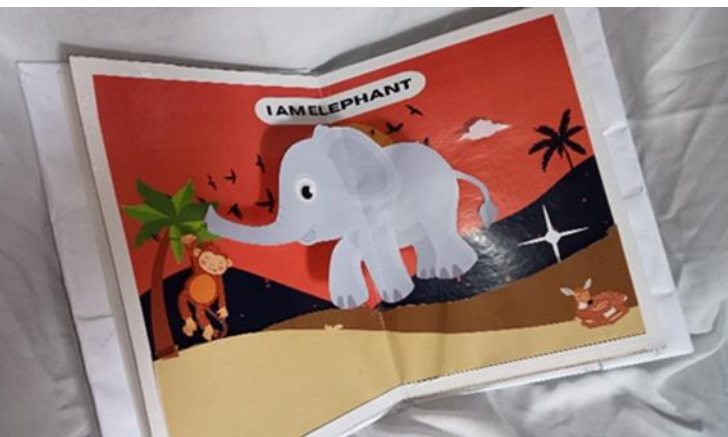
Gambar 4. Tampilan Halaman 2 "GAJAH"