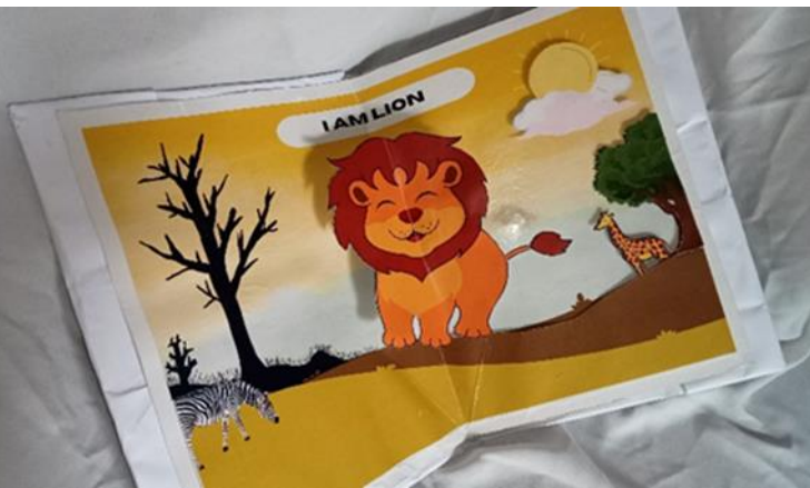
Gambar 2. Tampilan Halaman 1 "SINGA"