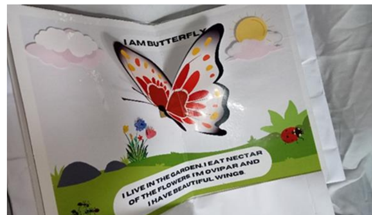
Gambar 7. Deskripsi Teks "KUPU-KUPU"