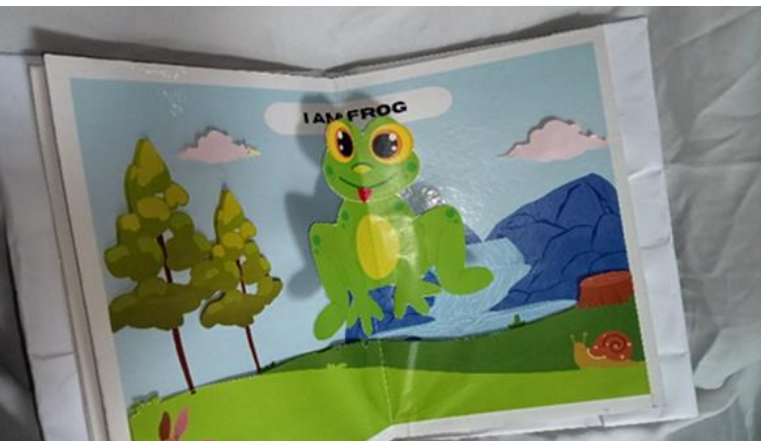
Gambar 8. Tampilan Halaman 4 “KATAK”