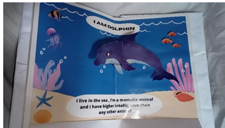
Gambar 11. Deskripsi Teks “LUMBA-LUMBA”