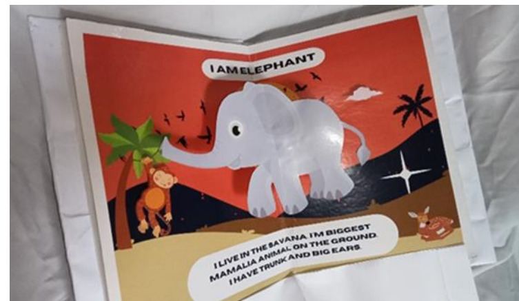
Gambar 5. Deskripsi Teks "GAJAH"