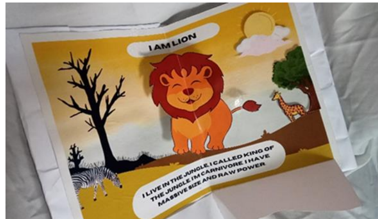
Gambar 3. Deskripsi Teks "SINGA"