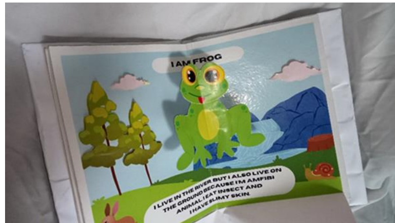
Gambar 9. Deskripsi Teks “KATAK”