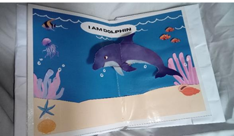
Gambar 10. Tampilan Halaman 5 “LUMBA-LUMBA”