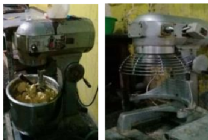
Gambar 3. Alat Pembuat Adonan Kue Pia