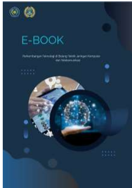
Gambar 2. Tampilan Sampul

Kemudian pada halaman menu utama terdapat beberapa pilihan menu diantaranya terdapat menu materi, dan kuis latihan. Halaman Menu Utama ditunjukkan pada Gambar 3.