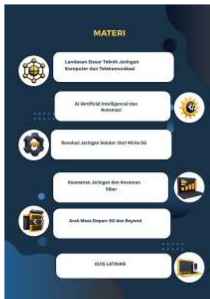
Gambar 3. Halaman Menu

Kemudian pada halaman menu utama terdapat beberapa pilihan menu diantaranya terdapat menu materi, dan kuis latihan. Halaman Menu Utama ditunjukkan pada Gambar 3.