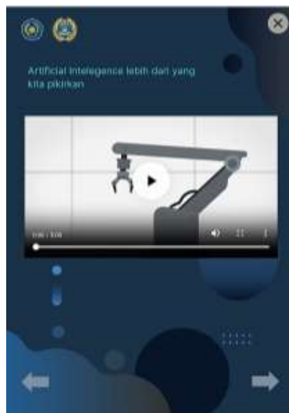
Gambar 5. Video Pembelajaran

Tampilan menu video pembelajaran berisi tombol navigasi kembali, home, dan menu materi-materi video pada pembelajaran. Video pembelajaran yang disajikan didalam aplikasi E-Book ini digunakan untuk menstimulus penalaran siswa terhadap pembelajaran dan mempermudah siswa dalam memahami materi yang akan disampaikan [17]. Tampilan menu video pembelajaran ditunjukkan pada Gambar 5.