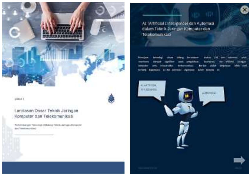
Gambar 4. Halaman Materi

Tampilan menu video pembelajaran berisi tombol navigasi kembali, home, dan menu materi-materi video pada pembelajaran. Video pembelajaran yang disajikan didalam aplikasi E-Book ini digunakan untuk menstimulus penalaran siswa terhadap pembelajaran dan mempermudah siswa dalam memahami materi yang akan disampaikan [17]. Tampilan menu video pembelajaran ditunjukkan pada Gambar 5.