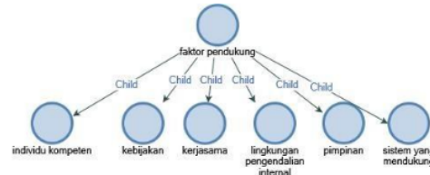
Gambar 1. Faktor pendukung dalam implementasi pengendalian internal

Hasil tanggapan kelima narasumber mengenai faktor yang menjadi pendukung dalam implementasi pengendalian internal di UMSIDA yang dipresentasikan Pada gambar 1 faktor – faktor inilah yang menjadi pendukung agar pengendalian internal berjalan secara optimal.