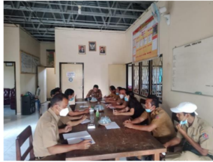
Gambar 1.2 Rapat Kerja Koordinasi Bagian Strategi Pelayanan SIPRAJA

Sumber : Dokumentasi Kelurahan Porong 2022