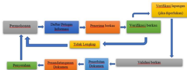
Bagan 1.2 Standart Operasional Prosedur SIPRAJA, 2023

Bagan dibawah ini adalah bentuk Standart Operasional Prosedur SIPRAJA, dari bagan ini menunjukkan secara jelas mengenai alur prosedural pelayanan SIPRAJA. Dengan adanya SOP ini akan memudahkan para staff desa untuk memberikan pelayanan secara cepat dan efisien sebab semua prosedur telah ditentukan seperti bagan yang dilampirkan diatas, mulai input pelayanan awal sampai dengan output atau hasil pelayanan. Sehingga dalam konteks ini kejelasan tujuan menjadi efektif dan mudah di pahami.