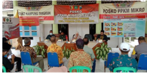
Gambar 1.3 Kegiatan Sosialisasi Kelurahan Porong