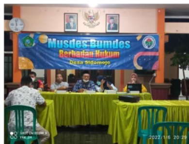
Gambar 2. Musyawarah BUMDes Desa Sidomojo

Musyawarah desa dilakukan di awal perencanaan BUMDes. Musyawarah desa tidak selalu dilakukan oleh perangkat desa, acara tersebut terakhir kali dilakukan pada 6 Januari 2022. Untuk awal adanya BUMDes masih terdapat masyarakat yang tidak mengerti mengenai BUMDes. Akan tetapi, setelah berselangnya tahun, masyarakat desa menjadi paham mengenai BUMDes dan kegiatannya. Saat ini, terdapat 7 ruko, diawal BUMDes ruko-ruko tersebut sepi penyewa. Untuk saat ini, mulai tersisa 1 ruko. Tetapi, rata-rata dari penyewa ruko tidak bertahan lama untuk melakukan usaha di tempat-tempat tersebut. Serta, dalam proses kegiatan