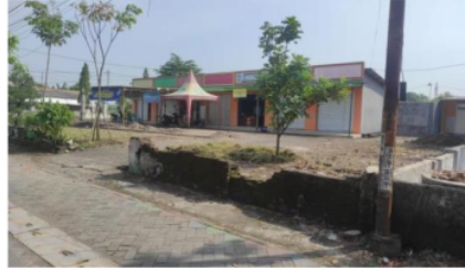
Gambar 1. Ruko di Desa Sidomojo

Pada gambar 1, menunjukkan jika benar di Desa Sidomojo menyewakan ruko dalam melakukan kegiatan BUMDes. Dapat dilihat pada gambar tersebut, jika ruko telah dibangun dengan baik dan memiliki halaman yang cukup luas. Desa Sidomojo mendirikan BUMDes dengan cara bertahap, setiap tahun BUMDes tersebut melakukan evaluasi untuk mencari atau memikirkan banyak inovasi baru.