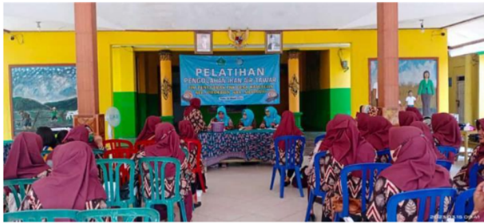
Gambar 4. Pelatihan Pengolahan Ikan Air Tawar (Lele) yang Diikuti Oleh Ibu- Ibu PKK

Pilar ketiga dalam ketahanan pangan adalah pemanfaatan pangan yang berasal dari sector pertanian atau perikanan. Dalam pilar ini bertujuan untuk menilai seberapa besar konsumsi pangan oleh rumah tangga dan kemampuan individu dalam menyerap dan metabolisme zat gizi. Tidak hanya itu dalam artian luas pilar ini juga dimaksudkan pada penggunaan hasil panen oleh rumah tangga dan kemampuan pada individu. Ada beberapa kegiatan yang dapat dilakukan dalam pemanfaatan pangan diantaranya meliputi cara penyimpanan pangan, pengolahan, dan terakhir adalah penyiapan makanan termasuk didalamnya adalah penggunaan air selama proses pengolahan pangan yakni kondisi kebersihan. Tidak hanya itu pemanfaatan pangan juga mencakup terkait distribusi makanan dalam rumah tangga yang sesuai dengan kebutuhan tiap individu, dan status kesehatan masing-masing anggota rumah tangga.