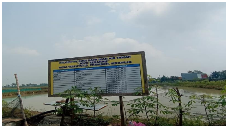
Gambar 1. Budidaya Ikan Air Tawar

Tidak jarang juga kendala yang dirasakan saat menjalankan program ketahanan pangan ini salah satunya adalah kendala teknis karena kurangnya sumber daya manusia untuk mengelola beberapa sektor tersebut dan kurangnya pengetahuan tentang cara pengelolaan di lapangan sehingga perlu adanya pembekalan dan pelatihan untuk pihak-pihak yang terlibat dalam program ketahanan pangan ini. Meskipun demikian pemerintah desa watutulis berupaya memfasilitasi berupa peralatan sehingga program ini dapat berjalan dengan lancar. Adapun peralatan yang disediakan oleh pemerintah desa watutulis adalah sebagai berikut :