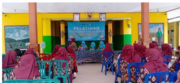
Gambar 4. Pelatihan Pengolahan Ikan Air Tawar (Lele) yang Diikuti Oleh Ibu- Ibu PKK

Pilar ketiga dalam ketahanan pangan adalah pemanfaatan pangan yang berasal dari sector pertanian atau perikanan. Dalam pilar ini bertujuan untuk menilai seberapa besar konsumsi pangan oleh rumah tangga dan kemampuan individu dalam menyerap dan metabolisme zat gizi. Tidak hanya itu dalam artian luas pilar ini juga dimaksudkan pada penggunaan hasil pangan oleh rumah tangga dan kemampuan pada individu. Ada beberapa kegiatan yang dapat dilakukan dalam pemanfaatan pangan diantaranya meliputi cara penyimpanan pangan, pengolahan, dan terakhir adalah penyiapan makanan termasuk didalamnya adalah penggunaan air selama proses pengolahan pangan yakni kondisi kebersihan. Tidak hanya itu pemanfaatan pangan juga mencakup terkait distribusi makanan dalam rumah tangga yang sesuai dengan kebutuhan tiap individu, dan status kesehatan masing-masing anggota rumah tangga.