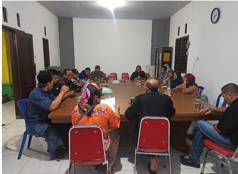
Gambar 3. Rapat Tertutup Perangkat Desa , BPD Dengan Pengurus Program

“Jika persediaan pangan ini dirasa kurang untuk memenuhi kebutuhan pangan masyarakat desa maka pihak pemerintah desa akan mengadakan rapat secara tertutup dengan seluruh perangkat desa dan dihadiri oleh para pengurus yang sudah ditetapkan untuk bersama-sama mencari solusi agar terpenuhi ketersediaan pangan dari budidaya ikan air tawar (lele) dan pertanian dengan hasil padi. Untuk budidaya ikan air tawar sendiri secara keseluruhan bisa sedikit terpenuhi kebutuhan masyarakat desa meskipun tidak semua masyarakat mengkonsumsi ikan lele, dan untuk sektor pertanian belum terpenuhi didesa sehingga masyarakat membeli diluar desa. Selama ini ada upaya peningkatan karena dengan adanya program ketahanan pangan Desa bisa membantu BUMDes untuk menambah pemasukan dan masyarakat juga bisa mendapat lapangan pekerjaan karena SDM dari warga”. (Wawancara 4 januari 2023, oleh Indra Yatiningasih sebagai Sekretaris Desa Watutulis.