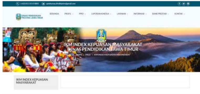
Gambar 2. Hasil temuan peneliti terkait tidak ditampilkannya indeks kepuasan masyarakat kepada Pelayanan Informasi Publik Dinas Pendidikan Provinsi Jawa Timur.

Tolak ukur adalah standar, kriteria, atau parameter yang digunakan sebagai dasar untuk membandingkan atau menilai sesuatu. Dalam konteks perbandingan antara UUKIP No. 14/2008 dan Peraturan Gubernur Provinsi Jawa Timur Nomor 8 Tahun 2018, "tolak ukur" merujuk pada prinsip-prinsip atau aspek-aspek tertentu yang digunakan untuk membandingkan bagaimana keduanya mengatur kelayakan publikasi informasi publik. Tolak ukur ini membantu dalam mengevaluasi sejauh mana kedua regulasi tersebut memenuhi standar keterbukaan informasi publik. Maka dapat dijelaskan dalam bentuk tabel dibawah ini: