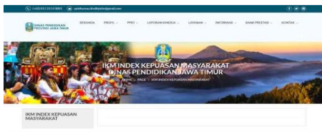
Gambar 2. Hasil temuan peneliti terkait tidak ditampilkannya indeks kepuasan masyarakat kepada Pelayanan Informasi Publik Dinas Pendidikan Provinsi Jawa Timur.