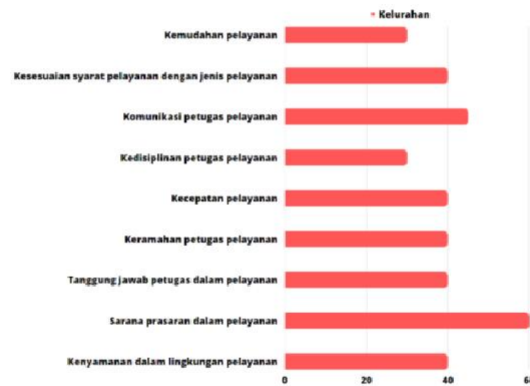
Gambar 1.1 Survey Kepuasan Masyarakat Pengakses Layanan Desa Pemerintah Kabupaten Pasuruan