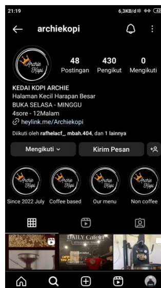
Gambar 1. Tampilan Profil Instagram Archie Kopi

Setelah pelanggan membeli produk setelah melihat postingan promosi tersebut, pihak Archie Kopi mulai menggunakan Instagram sebagai media promosi. Archie Kopi mempromosikan dirinya melalui Instagram karena hal tersebut. Pemilik Rafhel mengklaim bahwa Instagram lebih disukai sebagai media promosi karena kepraktisan dan daya tariknya. Pemilik Archie Kopi mengatakan bahwa keunggulan platform Instagram sebagai alat pemasaran adalah karena basis pengguna platform yang besar dan terus berkembang. Dengan demikian Archie Kopi lebih mungkin dikenal oleh banyak orang karena banyaknya pengguna Instagram yang sudah ada di platform tersebut.