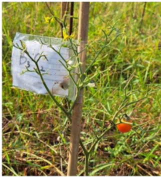
Gambar 8. Tomat 56 HST