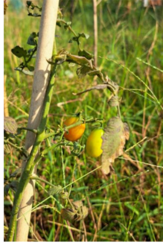
Gambar 5. Tomat usia 35 HST