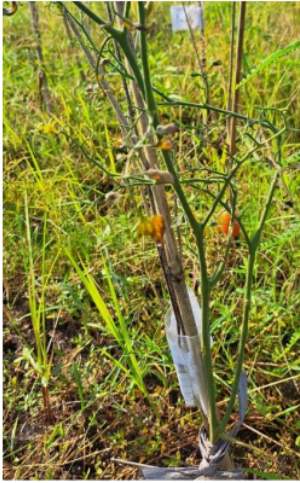
Gambar 4. Tomat usia 28 HST