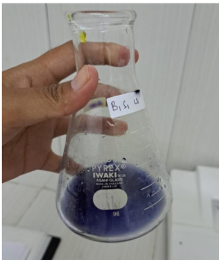
Gambar 10. Uji tingkat kandungan Vit C buah