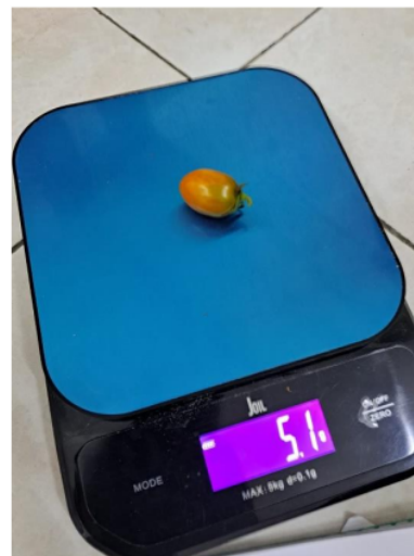
Gambar 11. Berat Basah perbuah