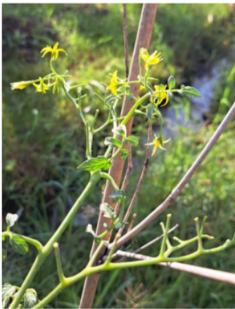
Gambar 2. Tomat usia 14 HST