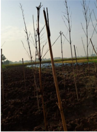
Gambar 1. Persiapan lahan