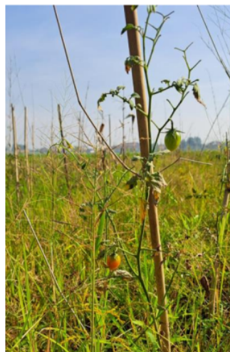
Gambar 7. Tomat 49 HST