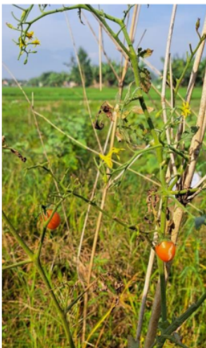
Gambar 6. Tomat 42 HST