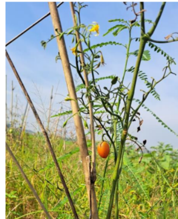
Gambar 3. Tomat usia 21 HST