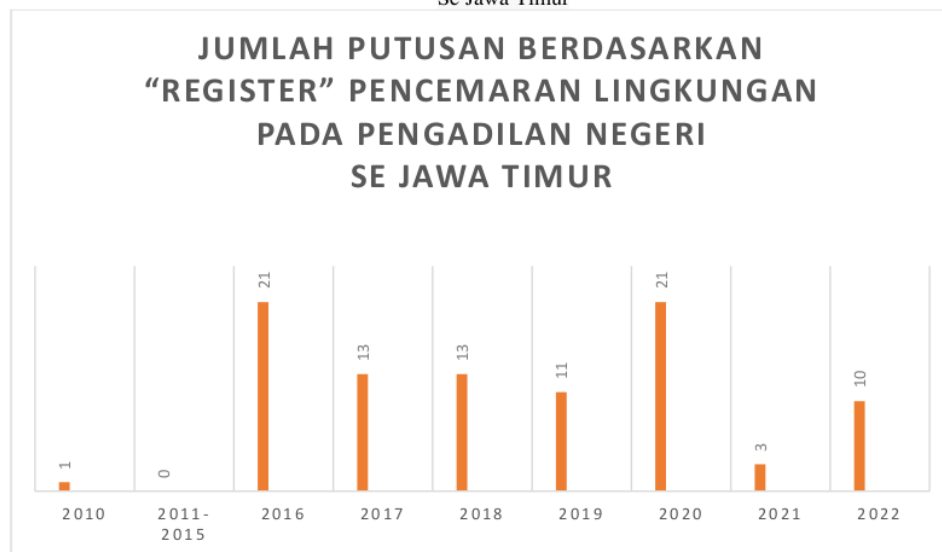
Gambar 2. Jumlah Putusan berdasarkan “Register” Pencemaran lingkungan pada Pengadilan negeri Se Jawa Timur

Dari gambar 2 “Register” Putusan Pengadilan Negeri Se Jawa Timur dapat dilihat bahwa pada tahun 2010 terdapat 1 register, pada tahun 2011-2015 tidak terdapat register, pada tahun 2016 terdapat 21 register, pada tahun