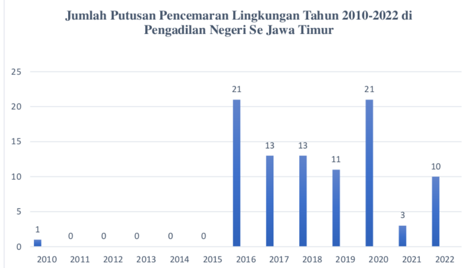
Gambar 1. Jumlah Putusan Pencemaran Lingkungan Tahun 2010-2022 di Pengadilan Negeri Se Jawa Timur

Berdasarkan data putusan pengadilan pada gambar 1 diatas menunjukkan pada tahun 2010 terdapat 1 putusan, pada tahun 2011 tidak terdapat putusan, pada tahun 2012 tidak terdapat putusan, pada tahun 2013 tidak terdapat putusan, pada tahun 2014 tidak terdapat putusan, pada tahun 2015 tidak terdapat putusan, pada tahun 2016 terdapat 21 putusan, pada tahun 2017 terdapat 13 putusan, pada tahun 2018 terdapat 13 putusan, pada tahun 2019 terdapat 11 putusan, pada tahun 2020 terdapat 21 putusan, pada tahun 2021 terdapat 3 putusan, pada tahun 2022 terdapat 10 putusan. Jumlah Putusan Pencemaran Lingkungan Tahun 2010-2022 di Pengadilan Negeri Se Jawa Timur dengan total putusan 93 putusan