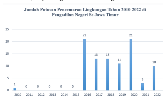
Gambar 1. Jumlah Putusan Pencemaran Lingkungan Tahun 2010-2022 di Pengadilan Negeri Se Jawa Timur

Data Putusan Berdasarkan Jumlah Putusan pencemaran lingkungan di PN Se Jawa Timur, jumlah putusan berdasarkan tahun register dan putusan berdasarkan Putus Terkait Kasus Pencemaran Lingkungan Se-Jawa Timur dalam Direktori Putusan Mahkamah Agung. Analisis mengenai penegakan hukum terhadap pencemaran lingkungan di Provinsi Jawa Timur antara tahun 2010 hingga 2022 melibatkan berbagai faktor yang termasuk peraturan hukum, implementasi, tantangan, dan dampak yang dihasilkan. Dalam periode tersebut, Jawa Timur telah cukup banyak terjadi kasus pencemaran lingkungan yang terjadi, untuk menangani permasalahan tersebut tentu diperlukan proses penegakan hukum. Adapun terkait banyaknya jumlah kasus pencemaran lingkungan yang diterima oleh setiap Pengadilan Negeri di Provinsi Jawa Timur, dapat digambarkan sebagaimana tabel berikut: