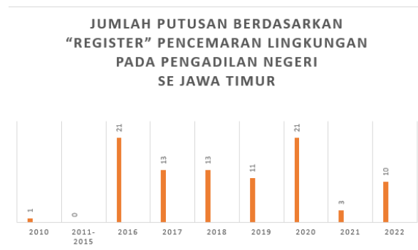
Gambar 2. Jumlah Putusan berdasarkan “Register” Pencemaran Lingkungan pada Pengadilan Negeri Se Jawa Timur

Berdasarkan data putusan pengadilan pada gambar 1 diatas menunjukkan pada tahun 2010 terdapat 1 putusan, pada tahun 2011 tidak terdapat putusan, pada tahun 2012 tidak terdapat putusan, pada tahun 2013 tidak terdapat putusan, pada tahun 2014 tidak terdapat putusan, pada tahun 2015 tidak terdapat putusan, pada tahun 2016 terdapat 21 putusan, pada tahun 2017 terdapat 13 putusan, pada tahun 2018 terdapat 13 putusan, pada tahun 2019 terdapat 11 putusan, pada tahun 2020 terdapat 21 putusan, pada tahun 2021 terdapat 3 putusan, pada tahun 2022 terdapat 10 putusan. Jumlah Putusan Pencemaran Lingkungan Tahun 2010-2022 di Pengadilan Negeri Se Jawa Timur dengan total putusan 93 putusan