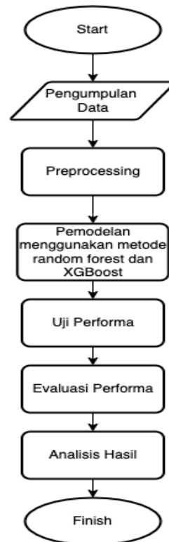
Gambar 1 Desain Sistem

Perancangan perangkat lunak diawali dengan tahap preprocessing. Jika data telah melalui tahap Preprocessing, maka dilakukan modelling menggunakan metode Random Forest dan XGBoost[12]. Untuk mendapatkan parameter terbaik, peneliti menggunakan teknik Grid Search Cross Validation dengan cross validation 5 untuk melakukan tuning pada saat pemodelan. Pada gambar 1, merupakan alur perancangan sistem pada penelitian ini, berjalan melalui beberapa proses mulai dari pengumpulan data, preprocessing data awal, processing dan pemodelan metode random forest dan Xgboost, hingga tahap analisis hasil supaya menciptakan hasil yang akurat.