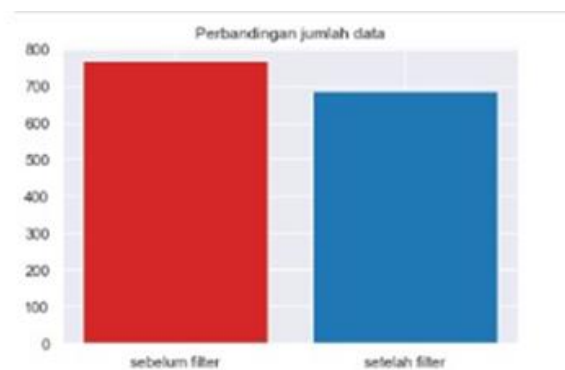
Gambar 4 Proses Outlier

Tahap berikutnya melibatkan penanganan outlier menggunakan metode Z-score. Z-score digunakan untuk membantu mengidentifikasi apakah suatu data termasuk dalam kategori outlier atau tidak. Data outlier merujuk pada data yang memiliki nilai yang signifikan dari rata-rata. Pedoman umum adalah jika nilai Z-score lebih kecil dari -3 atau lebih besar dari +3, data dianggap sebagai nilai ekstrem. Karena itu, data yang melampaui batas-batas ini akan dihilangkan dari dataset.