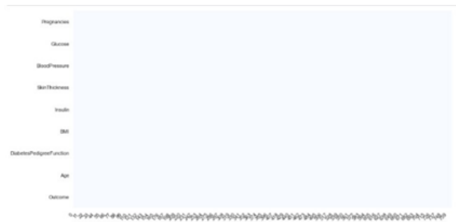
Gambar 3 Hasil Missing Value

Dapat diamati dari gambar 3, bahwa proses pengisian data dilakukan secara komprehensif sehingga tidak ada nilai yang terlewatkan. Presentasi visual dalam gambar 3 mencerminkan keseragaman warna yang sama. Pengamatan ini mengindikasikan bahwa pengisian nilai telah berhasil dilakukan dengan sukses.