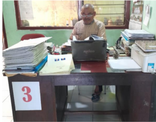
Gambar 3. Sarana dan prasarana menunjang pelayanan Kantor Urusan Agama Prambon

Gambar berikut merupakan tiga meja pelayanan dari Kantor Urusan Agama Prambon dengan memiliki perangkat Komputer, cpu, printer serta laptop pegawai yang digunakan mendukung pelayanan dalam kantor urusan agama.