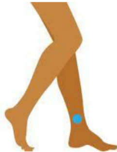
2.1 Gambar lokasi titik SP6

Pada kelompok akupresur peneliti melakukan terapi akupresur pada titik SP6 dan LV3 dilakukan selama satu hari dengan pemijatan searah jarum jam sebanyak 30 putaran masing-masing titik 5 menit. Pada kelompok kombinasi akupresur dan kompres hangat cara untuk penentuan temperatur air panas dapat menggunakan tangan atau siku, dengan cara mendiamkan siku selama 5-10 detik di air untuk memperoleh suhu kasar air. Jika air terasa agak hangat, tetapi tidak panas artinya air bersuhu sekitar 38°C.