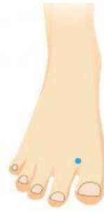
2.2 Gambar lokasi titik LV3

Gambar 2.1 Titik Sanyinjiao (SP6) merupakan titik meridian yang berhubungan dengan organ limpa, hati dan ginjal. Titik ini berada 4 jari diatas mata kaki/ malleolus internus [12]. Gambar 2.2 Titik Daichong (LV3) merupakan titik meridian liver. Titik ini terletak diantara jari kaki jempol dan telunjuk [13].