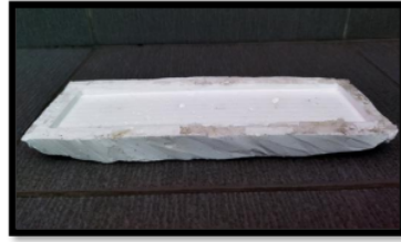
Gambar 3. Cetakan Serat Sansivera