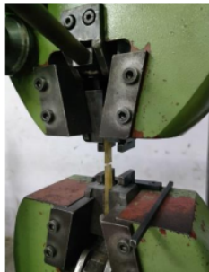
Gambar 2. Uji Tarik Serat

Pengujian tarik serat diawali dengan menentukan nilai berat beban sebesar 1,5N dengan kecepatan berat sebesar 150 mm/min dan test speed 100 mm/min. Pengujian ini menggunakan mesin uji ZwickRoell dengan standart ASTM E8 DIN EN ISO 6892-1.