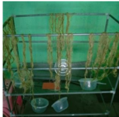
Gambar 1. Serat Lidah Mertua proses Pengeringan

Serat alam pada penelitian ini menggunakan serat sansivera yang berasal dari daun lidah mertua yang telah diseleksi dan direndam selama 30 hari dan dijemur pada suhu ruangan hingga serat kering.