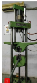
Gambar 5. Mesin Uji Tarik Komposit

Weight = 1000 Kg Power = AC220V, 50Hz Accuracy = ± 0,5% Display Device = PC Elongation Accuracy = 0,001 mm Capacity = 5000 Kg