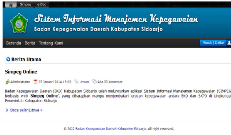
Gambar 1. Aplikasi SIMPEG

Daerah (BKD) Kabupaten Sidoarjo. Badan Kepegawaian Daerah (BKD) Kabupaten Sidoarjo merupakan kabupaten pertama yang menggunakan SIMPEG sebab Kabupaten Sidoarjo telah melakukan pembangunan SIMPEG sejak tahun 1997, hal tersebut sejalan dengan ditunjuknya Kabupaten Sidoarjo sebagai daerah percontohan otonomi daerah [11].