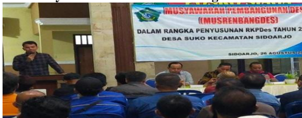
Gambar 3.4 Musyawarah Rencana Pembangunan Desa

Dalam menentukan rencana program pembangunan fisik Desa, diselenggarakan Musyawarah Rencana Pembangunan Desa guna memprioritaskan kebutuhan masyarakat terkait pembangunan fisik Desa.