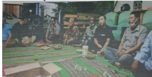
Gambar 3.3 Musyawarah Dusun

Pada tahapan penyusunan RPJMDes, musyawarah dusun menjadi tahapan wajib yang dilaksanakan sebelum musrenbangdes. Tim Penyusun RPJMDes merekap aspirasi masyarakat dalam hasil musyawarah dusun.