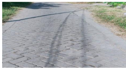
Gambar 3.2 Program Pavingisasi

Berdasarkan hasil wawancara diatas dapat disimpulkan bahwa partisipasi masyarakat dalam penyediaan data dan informasi adalah masyarakat terlibat dalam memberikan informasi mengenai kondisi lingkungannya. Masyarakat Desa Suko mengidentifikasi dan menganalisis terkait kondisi lingkungannya untuk disampaikan kepada ketua RT dan ketua RW setempat pada saat musyawarah dusun dilaksanakan.