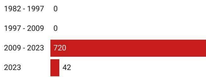
Chart: Ferdi Safari • Created with Datawrapper