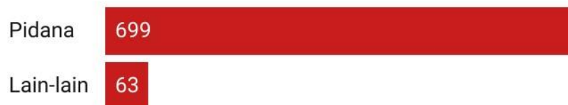
Chart: Ferdi Safari • Created with Datawrapper