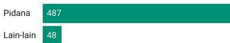
Chart: Ferdi Safari • Created with Datawrapper