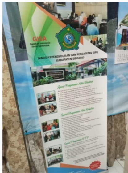
Gambar 2. Poster Standar Pelayanan

"Ini tadi saya cuman mau minta surat keterangan belum menikah soalnya saya mau melamar pekerjaan, tapi tidak tahu persyaratannya apa saja jadi saya bolak-balik, dulu kan cuman surat pengantar dari RT sama RW aja sudah boleh mbak ternyata ini tadi katanya juga harus sama fotocopy Kartu Keluarga, fotocopy Kartu Tanda Penduduk, terus sama bukti pembayaran Pajak Bumi dan Bangunan yang terbaru, lah saya kan tidak tahu untuk persyaratan terbarunya apa, didalam ada poster standart pelayanan cuman tidak ada untuk syarat buat surat keterangan" (Nurul Abelia warga Desa Popoh, 2023)