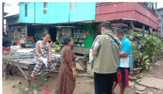
Gambar 1.2 Proses Verifikasi Penerima Bantuan Sosial Pkh dan Bpnt

Komunikasi interpersonal merupakan komunikasi yang dilakukan oleh dua orang atau lebih, dalam pemberian pesan atau menerima pesan yang menjadi tujuan dari komunikasi tersebut. Dalam kegiatan program pejuang muda ini, komunikasi interpersonal merupakan komunikasi yang paling sering dilakukan karena dimana proses komunikasi ini menjadi salah satu bagian penting dalam menyelesaikan program tersebut sampai selesai. Kegiatan yang dilakukan dengan berhubungan langsung kepada masyarakat daerah setempat, serta seluruh stakeholder yang ikut mendukung adanya program ini.