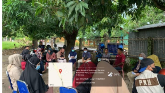
Gambar 1.3 Kegiatan Rapat Bersama Dinas Sosial Kota Parepare

Komunikasi kelompok merupakan komunikasi yang dilakukan oleh beberapa orang dalam bentuk kelompok kecil, dengan berinteraksi satu sama lain untuk mencapai tujuan bersama. Dalam kegiatan ini komunikasi kelompok merupakan komunikasi yang digunakan untuk beberapa hal seperti kegiatan evaluasi, ataupun melakukan perencanaan yang akan dilakukan kedepannya dengan berkoordinasi antara tim pejuang muda dan pegawai pemerintahan dinas sosial Kota Parepare.