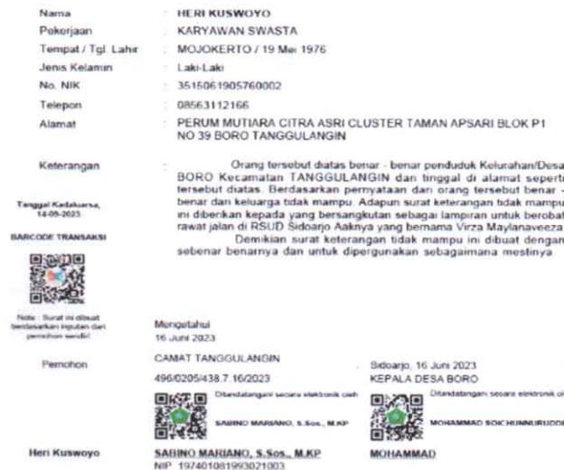
Gambar 2. Surat Keterangan Tidak Mampu

Yang bertanda tangan di bawah ini Kepala Desa Boro Kecamatan Tanggulangin Kabupaten Sidoarjo Menerangkan dengan sebenar-benarnya bahwa orang tersebut di bawah ini