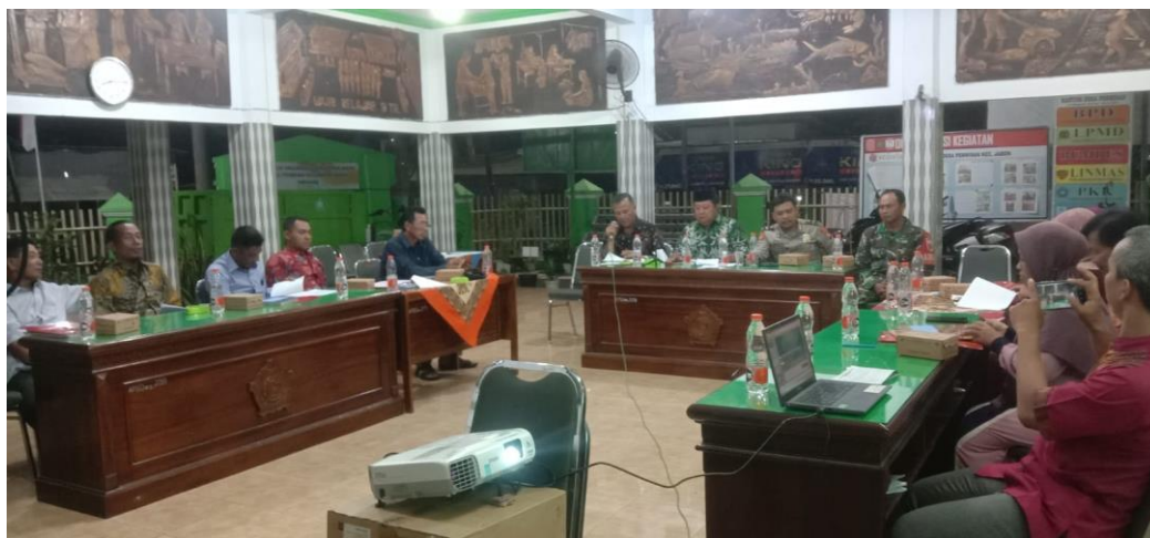
Gambar 3. Kegiatan Sosialisasi SiPraja

Akan tetapi penulis menemukan bahwa banyak masyarakat usia tua yang kurang mempercayai penjelasan yang diberikan oleh admin karena admin dianggap masih muda (faktor usia), sehingga admin memerlukan petugas lain di kelurahan yang usianya lebih tua untuk membantu meyakinkan amsyarakat. Kepala kelurahan selaku pimpinan di Desa Boro seharusnya sudah ikut andil dalam memberikan sosialisasi kepada masyarakat, khususnya masyarakat usia tua untuk menghimbau agar dalam pelayanan publik tidak memandang rentang usia antara usia muda dan usia tua. Hal tersebut mengingat ketua RT dan RW Sebagian belum menyampaikan hasil informasi ataupun sosialisasi dari adanya aplikasi SiPraja. Hal seperti inilah yang harus diperhatikan oleh pemerintah daerah ataupun kelurahan dalam melayani pengguna jasa agar tercipta pelayanan yang baik terhadap masyarakat. Berikut merupakan kegiatan sosialisasi yang dilakukan di Desa Boro Sebagai berikut: