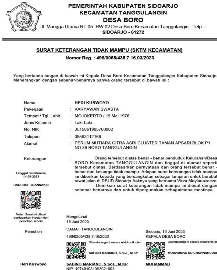
Gambar 2. Surat Keterangan Tidak Mampu

Jika surat telah selesai ditandatangani secara elektronik oleh camat atau kepala desa maka pemohon akan menerima notifikasi yang dikirim ke pemohon berupa pesan elektronik SiPraja dan email SiPraja, selanjutnya masyarakat tinggal mencetak mandiri dirumahnya.