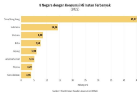
Gambar 1 Grafik Negara Konsumsi Mie Instan Terbanyak di Dunia

Perkembangan industri makanan di Indonesia semakin pesat yang mengakibatkan munculnya berbagai persaingan sehingga perusahaan perlu memilih strategi yang tepat dan efektif. Bisnis yang ada salah satunya mie instan. Di era modern saat ini, mendorong masyarakat khususnya Indonesia mengubah gaya hidup dan pola konsumsi secara cepat dan instan. Berdasarkan data World Instant Noodles Association (WINA) dalam tahun 2022 konsumsi mie instan di Indonesia semakin meningkat 7,46% dibandingkan tahun sebelumnya sebanyak 14,26 miliar porsi [1]. Dari jumlah tersebut Indonesia berada di posisi kedua di dunia yang paling banyak mengkonsumsi setelah China.