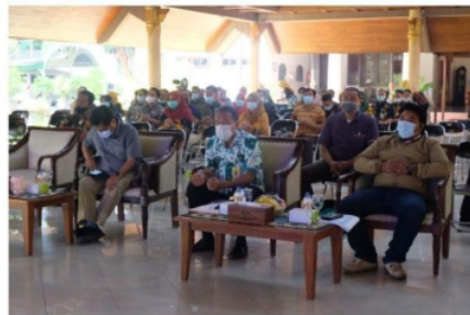
Gambar 4. Sosialisasi Pemkab dan PPID

Dalam penerapan dan dijalankan perintah yang diberikan dalam suatu komunikasi haruslah konsisten, karena jika perintah yang diberikan sering berubah-ubah dapat menimbulkan kebingungan bagi pelaksana dilapangan untuk kebijakan yang dijalankan. Oleh karnanya bagi pembuat kebijakan dengan pelaku kebijakan atau yang menjalankan harus saling terkait dalam tujuan kebijakan tersebut dibuat. Dari informasi yang diperoleh dilapangan para implementator menyatakan bahwa dirinya hanya menjalankan website sistem informasi desa ini sesuai dengan apa yang mereka ketahui yang dimana informasi didapatkan dari dua kali pertemuan sosialisasi yang diselenggarakan tentang mekanisme sistem informasi desa sejak aplikasi mulai di jalankan. Berikut gambar sosialisasi Pemkab Sidoarjo wujudkan keterbukaan informasi publik dengan sosialisasi PPID Desa.