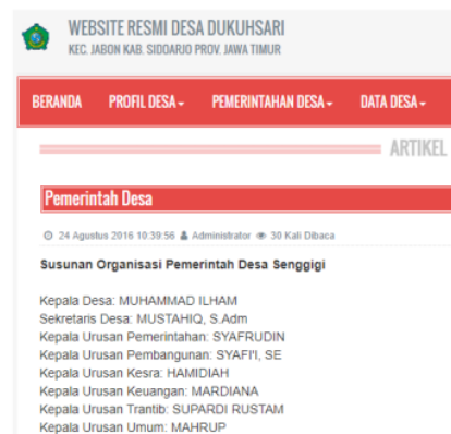
Gambar 1. Sistem Informasi Desa Dukuhsari