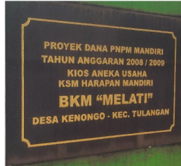
Gambar 1 Prasasti Unit Usaha Bumdes