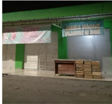
Gambar 2 Kios Aneka Usaha