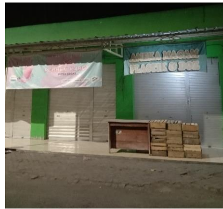
Gambar 2 Kios Aneka Usaha