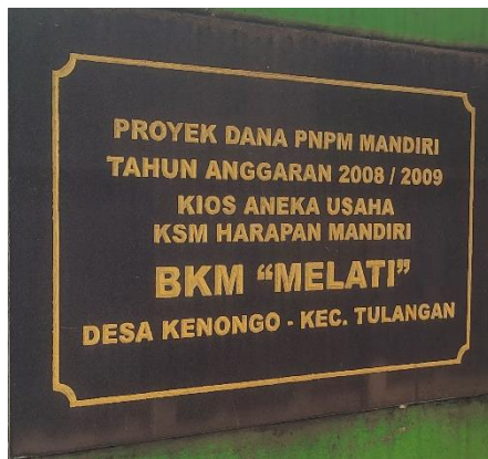
Gambar 1 Prasasti Unit Usaha Bumdes