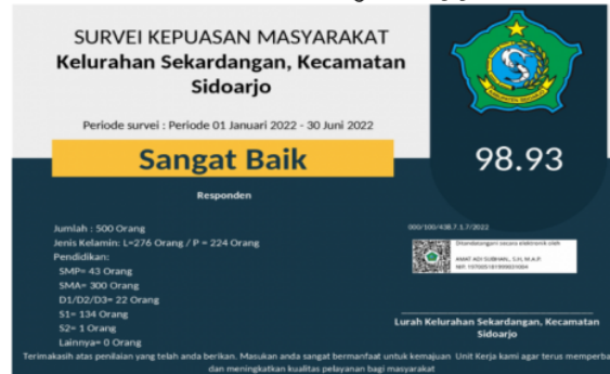
Gambar 1.2 Contoh gambar [1]

“Selaku penyelenggara pelayanan punya survey kepuasan masyarakat di desa Sekardangan mendapatkan nilai kepuasan 98.93 yang dikategorikan sangat baik jadi masyarakat merasa puas. Setiap tahun pemerintah desa Sekardangan mengevaluasi pelayanan publik yang dinilai langsung oleh Kemapanrb.”