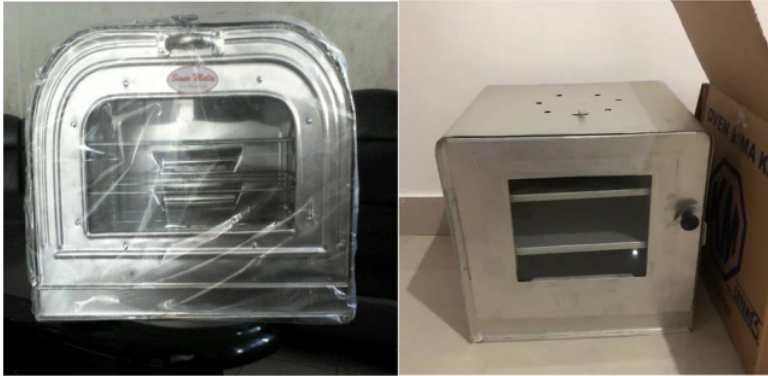
Gambar 3. Perbedaan Produk saat ini dengan hasil pengembangan

Gambar 4 berikut ini adalah sebuah gambar dari produk sebuah awal dan produk inovasi oven otomatis darisebuah penelitian ini. Dapat terlihat perbedaan yang signifikan dari kedua produk berikut.