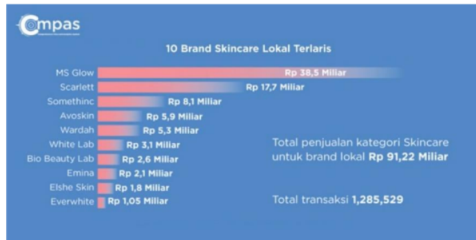
Gambar 1. Penjualan produk skincare Lokal di Indonesia 2022

Data pada gambar tersebut dapat menunjukkan bahwa Scarlett Whitening berada pada urutan ke 2 dari 10 brand skincare lokal yang diminati oleh masyarakat Indonesia pada tahun 2022 dengan total penjualan sebesar Rp. 17,7 Miliar. Dan peringkat terakhir diduduki oleh produk kecantikan lokal Everwhite dengan total penjualan sebesar Rp. 1,05 Miliar data tersebut membuktikan bahwa produk Scarlett Whitening mampu untuk bersaing dengan produk kecantikan lokal lainnya [4]. Melihat dari data tersebut dapat diketahui bahwa banyak pesaing dari Scarlett Whitening maka dari itu Scarlett Whitening berusaha untuk memberikan kualitas skincare yang cocok digunakan oleh khalayak terutama masyarakat Indonesia.