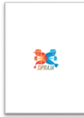
Gambar 2. Tampilan home layanan SIPRAJA