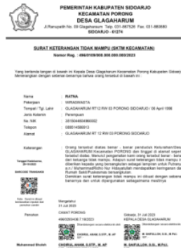
Gambar 1. Surat Keterangan Tidak Mampu