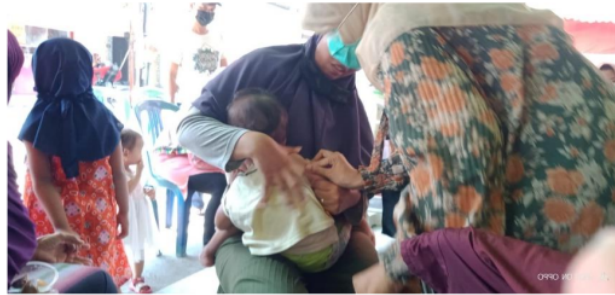
Gambar 3. Kegiatan pemberian vaksin di Posyandi Desa Pabean

Pada gambar 3 dapat diketahui bahwa pemberian vaksin terhadap balita di Posyandu Desa Pabean merupakan salah satu cara guna mencegah stunting pada balita di wilayah Desa Pabean Kecamatan Sedati Kabupaten Sidoarjo. Berdasarkan kesimpulan secara keseluruhan dengan indikator ketepatan sasaran tersebut bahwa Pemerintah Desa Pabean Kecamatan Sedati kabupaten Sidoarjo dapat dikatakan telah tepat sasaran. Karena Pemerintah Desa Melalui posyandu tersebut telah melaksanakan Program Keluarga Sadar Gizi (Kadarzi) dengan melakukan pemberian vitamin A, obat cacing, pendataan bayi-bayi yang mendapatkan asi eksklusif selama 6 bulan, pemberian imunisasi bagi bayi dan balita, pemberian dan makanan tambahan bagi sasaran serta kegiatan lain yang mendukung. Tidak hanya itu, yang lebih penting dalam upaya-upaya tersebut yakni melakukan deteksi dini pada 1000 Hari Pertama Kehidupan (HPK).