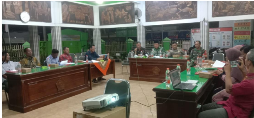
Gambar 4. Kegiatan Sosialisasi Desa Pabean

Berdasarkan gambar 4 di atas dapat diketahui bahwa pemerintah Desa Pabean melakukan kegiatan sosialisasi yang melibatkan Kasun, RW serta Ibu PKK dan Kader Posyandu Desa Pabean guna memberikan informasi mengenai program kadarzi dalam percepatan penurunan stunting . Dengan harapan program tersebut dapat di sampaikan kepada warga sekitar sehingga masyarakat juga sadar akan pentingnya stunting tersebut dicegah. Namun, sosialisasi tersebut belum seluruhnya masyarakat mengetahui program tersebut.