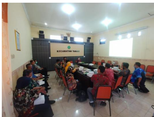
Gambar 3. Sosialisasi Aplikasi Sempel di Kecamatan Taman

Untuk mendukung pernyataan tersebut berikut ini merupakan dokumentasi saat pelaksanaan sosialisasi Aplikasi Sempel yang dilakukan oleh Dinas Pemberdayaan Masyarakat dan Desa.