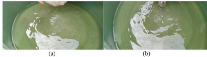
Gambar 2. Kondisi air yang diambil dari tambak terpal bundar (a) sebelum diberi perlakuan saponin (b) setelah diberi perlakuan saponin