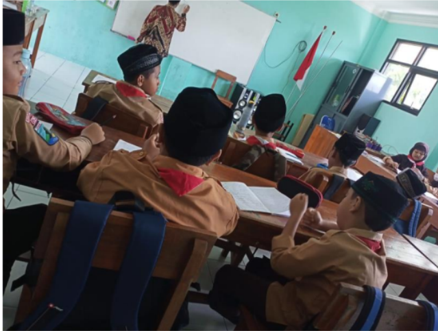
Gambar.1 suasana pembelajaran al-quran metode tartil kelas:5

Karena berdasarkan hasil wawancara dan pengamatan penulis sudah sekitar 85% peserta didik yang telah mampu memahami dan menguasai materi pada pembelajaran al-qur'an metode tartil di kelas 5 sdi wahid hasyim sekardangan sidoarjo. Hasil wawancara dengan guru pembina al-quran:"setiap pembelajaran al-quran anak-anak sangat antusias, tidak ada yang meninggalkan kelas, hal ini tentu dipengaruhi oleh metode dan sistem kita dalam mengajar, dengan at-tartil ini anak-anak sudah sekitar 85-90% memahami pembelajaran Al-Qur'an sehingga hampir semua itu sudah paham dan bisa praktik membaca secara langsung, setelah saya memberikan contoh-contoh bacaannya."