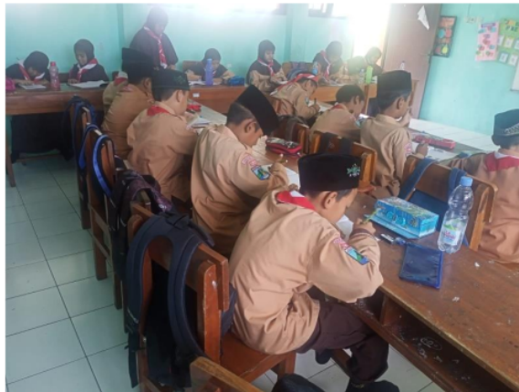
Gambar.2 ketertiban anak-anak waktu belajar

Sistem pembelajaran yang baik tentu mempengaruhi penerapan sehingga dari segi keunggulan, sistem pembelajaran di SDI wahid hasyim ini cukup unggul karena sistem pembelajaran al-quran melalui metode at-tartil ini diterapkan dengan sistem-sistem yang juga sangat inovatif.