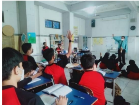
Gambar 6. Sesi Tanya Jawab

Keberhasilan pembelajaran adalah pembelajaran yang mengoptimalkan seluruh aktivitas aktif, inovatif, kreatif, siswa sehingga mereka merasa senang dalam belajar. Sehingga Guru PAI memerlukan alat bantu sarana dan prasarana yang menunjang proses pembelajaran tersebut.