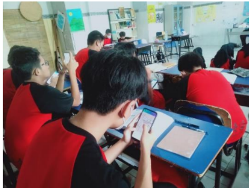
Gambar 2 pembuatan mind mapping

Hasil desain mind mapping di download untuk dibagikan. Lalu hasil desain pembuatan mind mapping bisa di presentasikan di depan kelas.