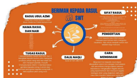
Gambar 3 Hasil desain siswa

Gambar 2 diatas merupakan proses pembelajaran yang dilakukan SMP Muhammadiyah 1 Sidoarjo dalam memanfaatkan media pembelajaran berupa aplikasi canva dalam pembuatan mind mapping. Pada proses pembelajaran di SMP Muhammadiyah 1 Sidoarjo guru PAI menggunakan model pembelajaran flipped classroom. Model pembelajaran flipped classroom ini siswa disuruh mempelajari materi terlebih dahulu dirumah. Setelah siswa memahami materi yang sudah dipelajari dirumah. Kegiatan selanjutnya di dalam kelas adalah penugasan untuk mengukur pemahaman siswa seperti melengkapi dan menganalisis mind mapping yang diberikan oleh guru dengan materi "Iman Kepada Rasul Allah". Setelah itu, hasil mind mapping yang sudah di desain pada aplikasi canva akan dipresentasikan oleh siswa di depan kelas seperti gambar 3 dibawah ini.