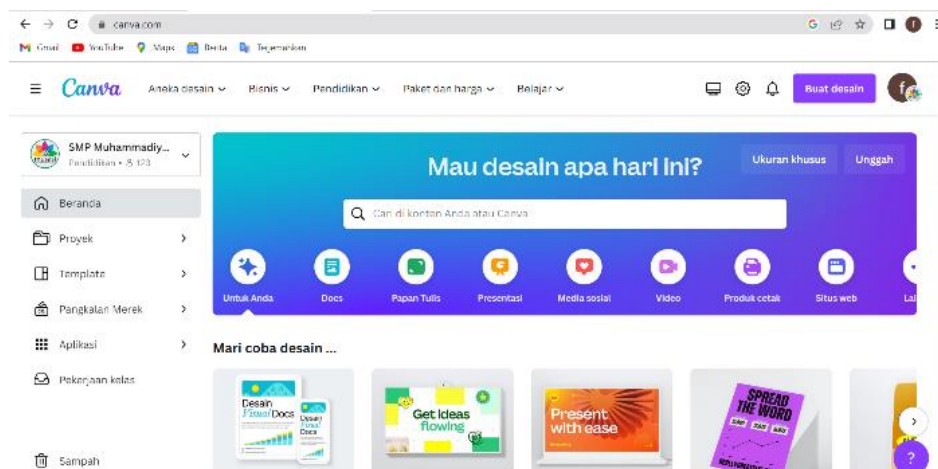
Gambar 1 web aplikasi canva

Pada gambar 1 merupakan aplikasi canva platform berbasis web yang dimanfaatkan untuk mendesain pembelajaran dengan berbagai desain yang menarik.[15]. Banyak orang yang memanfaatkan aplikasi canva untuk mendesain logo, poster atau content media sosial karena banyaknya fitur-fitur yang terdapat dalam aplikasi canva yang menjadi peluang bagi pendidik dalam memanfaatkan media pembelajaran, dengan mendesain pembelajaran yang menarik sesuai kreativitasnya masing-masing. Padahal aplikasi canva banyak manfaat bagi dunia pendidikan khususnya dalam proses belajar mengajar, seperti pembuatan mind mapping. Mind mapping biasanya berupa informasi secara singkat untuk memudahkan pembaca dalam memahami materi. Ada beberapa Langkah dalam pembuatan mind mapping dengan menggunakan aplikasi canva menjadi media yang bagus dan menarik. Hal ini dikarenakan canva memiliki banyak fitur yang komplet tetapi simple penampilannya sehingga mind mapping dapat dikerjakan secara efektif dan efisien. [16]