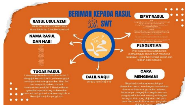
Gambar 3 Hasil desain siswa

Pada gambar 3 merupakan hasil desain siswa pada aplikasi canva dalam pembuatan mind mapping. Siswa dapat mengembangkan nilai kognitif dan nilai kreativitas pada siswa. Nilai kognitif C1-C6 seperti Mengingat (C1) Memahami (C2) Menerapkan (C3) Menganalisis (C4) Menilai (C5) Mencipta. memiliki tujuan yaitu melihat umpan balik peserta didik, sehingga materi pembelajaran berbasis teknologi digital ini dapat dipahami oleh siswa dan membantu siswa dalam meningkatkan nilai kognitif C1-C6 yaitu Mengingat (C1) Memahami (C2) Menerapkan (C3) Menganalisis (C4) Menilai (C5) Mencipta.