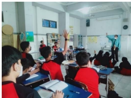
Gambar 6. Sesi Tanya Jawab

Gambar 6 merupakan kegiatan sesi tanya jawab siswa sangatlah aktif dalam menjawab pertanyaan-pertanyaan yang dilontarkan oleh guru. Keaktifan siswa dalam kelas terlihat sudah menguasai dan memahami materi, karena sebelumnya materi sudah dipelajari terlebih dahulu oleh siswa dirumah. Setelah itu guru menjelaskan dan mendalami lagi materi yang sudah di bagikan. Lalu siswa mencoba menganalisis materi lagi dalam bentuk mind mapping yang diberikan guru. Sehingga terciptanya pembelajaran efektif dan efisien