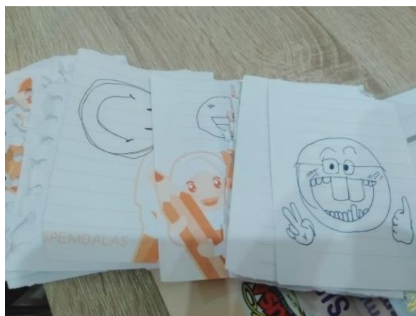
Gambar 7 feedback siswa

Gambar 6 merupakan kegiatan sesi tanya jawab siswa sangatlah aktif dalam menjawab pertanyaan-pertanyaan yang dilontarkan oleh guru. Keaktifan siswa dalam kelas terlihat sudah menguasai dan memahami materi, karena sebelumnya materi sudah dipelajari terlebih dahulu oleh siswa dirumah. Setelah itu guru menjelaskan dan mendalami lagi materi yang sudah di bagikan. Lalu siswa mencoba menganalisis materi lagi dalam bentuk mind mapping yang diberikan guru. Sehingga terciptanya pembelajaran efektif dan efisien