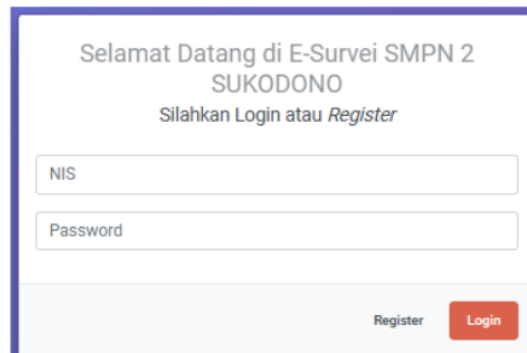
Gambar 4. Tampilan Login

Total nilai frekuensi yang didapat untuk setiap pertanyaan adalah 15.472 dengan persentase kelayakan sebesar 82,43%. Dengan total nilai atau persentase tersebut dapat dinyatakan bahwa guru mata pelajaran tersebut memenuhi kategori sangat baik. Dari data-data yang didapatkan, maka peneliti merencanakan sebuah konsep sistem untuk dijadikan hasil akhir penelitian ini. Dimana rancangan suatu sistem tersebut yang dibentuk untuk membuat suatu sistem perangkat lunak yang bisa diimplementasikan di SMPN 2 SUKODONO. Sistem perangkat yang dibuat berbasis website, sehingga dapat diakses melalui handphone, laptop, tablet dan lain sebagainya. Untuk tampilan login sebagai admin dan user bisa di lihat pada gambar 4 dibawah berikut. Jika sudah berhasil masuk menjadi admin maka akan ditunjukkan ke halaman admin, begitu juga sebaliknya jika berhasil sudah masuk sebagai user atau siswa.