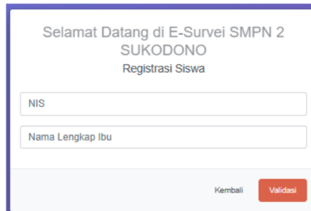
Gambar 5. Tampilan Login Validasi Siswa

Selanjutnya ada tampilan login validasi siswa yang sudah di masukan admin melalui menu tambah data siswa dan bisa di lihat di menu siswa belum register, kemudian masuk ke halaman login validasi untu melakukan validasi NIS dan Nama Ibu Kandung jika dicantumkan sebagai user atau siswa bisa dilihat pada gambar 5 berikut.