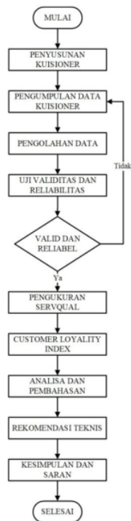
Gambar 1. Diagram Alir Penelitian

Diagram alir pada penelitian ini dapat dilihat sebagai berikut: