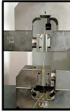
Gambar 2. Uji tarik serat