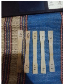
Gambar 4. Spesimen komposit serat sansivera.