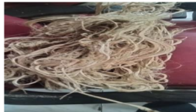
Gambar 1 Serat Sansivera

jenis serat alam yang berasal dari tanaman lidah mertua (Sansiviera). Pada penelitian ini peneliti melakukan seleksi terhadap daun tanaman lidah mertua yang akan digunakan, melakukan perendaman selama 30 hari,setelah proses perendaman pisahkan kulit dengan serat kemudian jemur disuhu ruangan sampai kering.