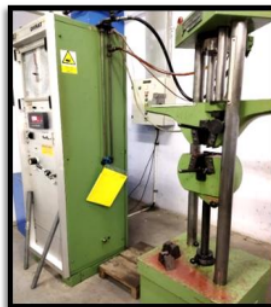
Gambar 5. mesin uji tarik komposit